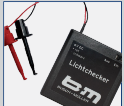
Lichtchecker Light Typ 1516LC1